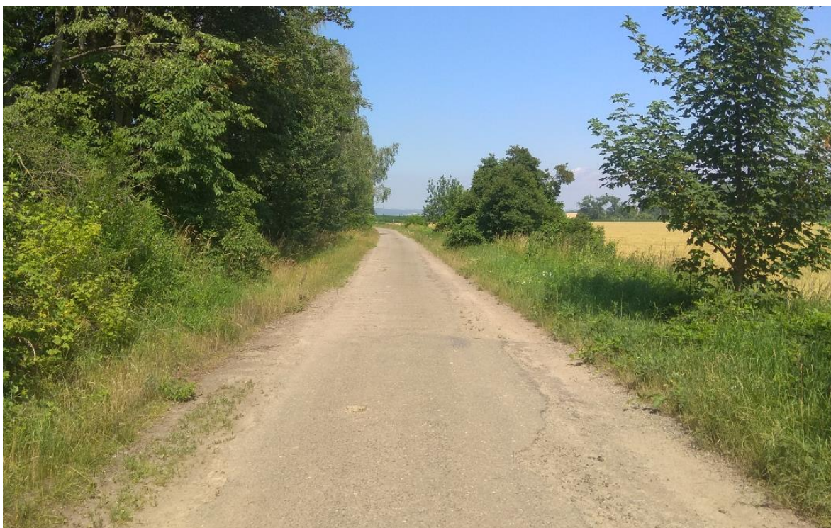
Úsek na trase D.