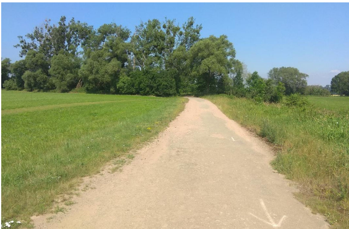
Úsek na trase C.